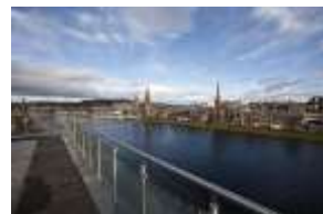
3* Hotel Inverness

Im Zentrum von Inverness, nur 5 Gehminuten von der High Street entfernt und mit Blick auf den River Ness, ist das Hotel der ideale Ausgangsort um Inverness, aber auch die Highlands zu entdecken. Die geräumigen Zimmer bieten einen Schreibtisch, einen Flachbild-TV und Kaffee-/Teezubehör.