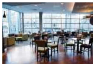
Hotel in Aberdeen