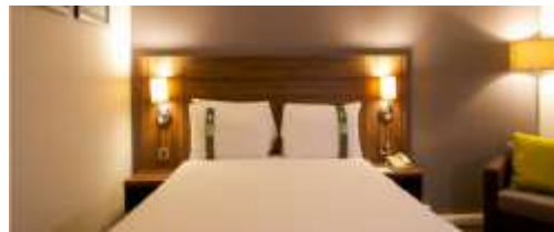
Hotel Liverpool Albert Dock

5. August : Heute steht der Tag im Zeichen der Beatles . Besuchen Sie zunächst das Beatles Museums. Nicht nur Musikliebhaber und Beatlesfans kommen hier auf ihre Kosten. Die Beatles Story am Albert Dock, nur eine Meile von Ihrem Hotel entfernt gelegen, ist beeindruckend gestaltet. Ein Audioguide leitet die Besucher durch das Museum. Von den Anfängen der Beatles, über die Jahre im Cavern Club und Hamburg, bis hin zur Beatlemania wird nichts ausgelassen.