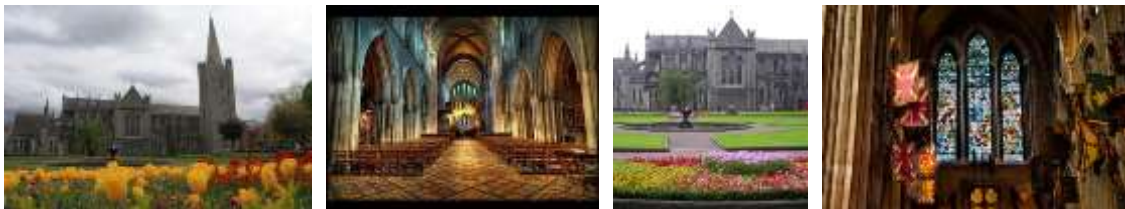
St. Patricks Cathedral

Besuchen Sie die St. Patrick's Cathedral , die 1213 erbaut wurde und heute die größte Kathedrale ist. Das Gotteshaus steht neben einer heiligen Quelle, an der der hl. Patrick um 450 n. Chr. zum Glauben Bekehrte getauft haben soll